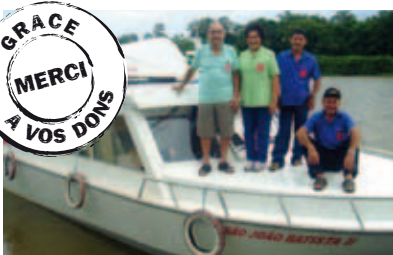
Longue vie au Saint Jean-Baptiste II !