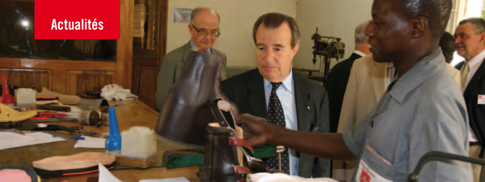
Thierry de Beaumont-Beynac, Président de l'Ordre de Malte France, lors de l'inauguration du CHOM. Dans le cadre de la réhabilitation fonctionnelle des malades, la cordonnerie conçoit les équipements nécessaires à leur réinsertion.