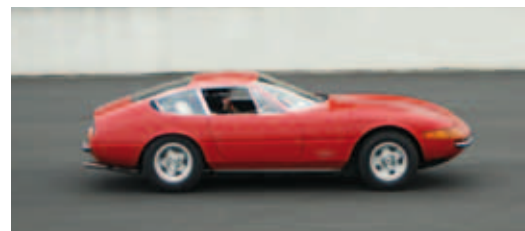
Une journée inoubliable pour tous les participants !