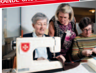
Les visites aux personnes âgées sont un grand réconfort, comme ici, dans l'un de nos établissements à Saint-Étienne.

LA SOLITUDE, GRANDE CAUSE NATIONALE 2011