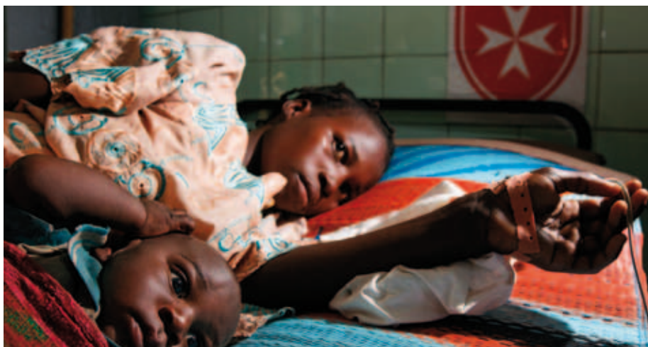
À l'hôpital Saint-Jean-de-Malte au Cameroun.

Le soutien des donateurs reste un élément essentiel du financement de nos programmes internationaux. Depuis 2010, un dispositif de parrainage permet à nos délégations départementales ou d'arrondissements de proposer localement à leurs bénévoles et partenaires (entreprises ou collectivités territoriales) d'être collectivement « parrains » d'un établissement, d'un programme ou d'un projet. La délégation de l'Oise a ainsi parrainé l'achat d'un monitoring fœtal pour le Pavillon Sainte-Fleur (Madagascar), celle de la Vendée, l'achat de deux couveuses pour l'hôpital de Djougou (Bénin), celles du Val d'Oise et de Paris, l'achat de deux couveuses pour l'hôpital de Njombé (Cameroun). Parmi les projets à parrainer en 2011 figurent six couveuses pour nos maternités d'Élavagnon (Togo) et de Sainte-Fleur, et deux moulins à farine pour la « Maison Marigot » de l'hôpital de Djougou. ■