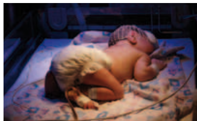
Un nouveau-né dans le service de néonatalogie de notre maternité de Bethléem.

En Afrique et en Palestine, la pauvreté des populations, les carences du réseau de soins et le manque de médicaments donnent un caractère particulièrement impérieux à la protection de la maternité et à l'accompagnement de la venue au monde. Pour protéger la vie des mères et de leurs enfants, l'Ordre de Malte France investit dans la création et la gestion de maternités et de services hospitaliers spécialisés qui offrent une médecine de grande qualité et rayonnent sur un vaste territoire géographique.