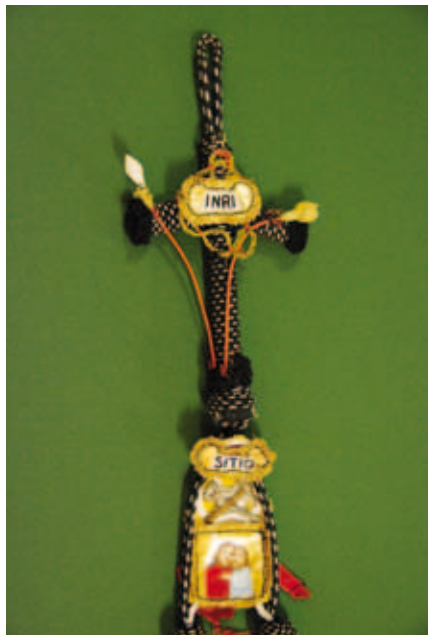
Détail de l'étoile portée par les chevaliers Profès.

L'Ordre de Malte est composé de fidèles qui sont prêts à s'engager pour l'Ordre et pour l'Église. Certains parmi eux prononcent en outre des vœux religieux : les chevaliers Profès.