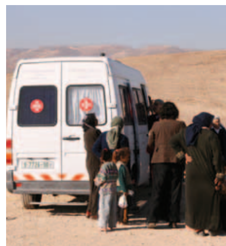
La clinique mobile de notre maternité de la Sainte-Famille à Bethléem.

au profit des villages les plus reculés et des campements bédouins du désert de Judée, ce programme de « stratégie avancée » se développe : un nouveau dispensaire mobile a été mis en service à Njombé (Cameroun) début 2011 ( lire page 3 ). L'unité mobile de la maternité de la Sainte-Famille à Bethléem, plus spécialement destinée aux mamans, effectue plus d'une centaine de sorties et près de 3 000 consultations par an ; les dispensaires mobiles de nos trois hôpitaux africains consultent chacun régulièrement dans une quarantaine de villages. ■