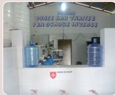
Station de traitement d'eau potable à Dondon.

Dans la zone montagneuse du Nord, le projet de lutte contre le choléra a, lui aussi, été mené à son terme avec la remise de la station de traitement d'eau potable au père Acnys Derozin, curé de la paroisse de Dondon. Cet équipement complète le dispositif déployé avec la formation des populations contre la propagation de la maladie et la construction de 14 groupes de latrines.