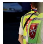
Photo de couverture : Nos secouristes bénévoles se mobilisent toute l'année pour secourir et sauver des vies.