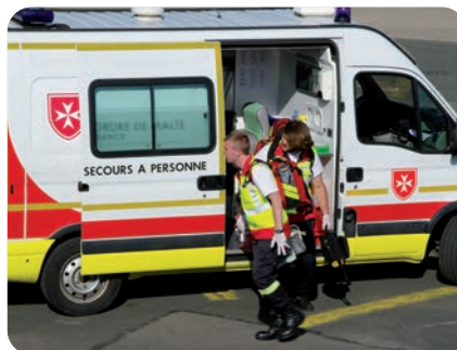
Véhicule de Premiers Secours à Personne.

sionnelle. Rapidement rejoint par une poignée d'amis très motivés, l'unité a immédiatement été sollicitée pour participer au poste de secours du 18 e duathlon des Sables d'Arc sur Tille. L'équipe a ensuite renforcé ses rangs, complété ses formations et participé à quelques-uns de nos grands postes nationaux, comme le Salon du cheval ou la Saint-Sylvestre. Elle a lancé une campagne de communication avec le soutien actif de la délégation, qui s'est mise en quatre pour financer un véhicule d'intervention. Résultat : une vingtaine de bénévoles et 25 à 30 postes en prévision pour cette saison 2013. ■