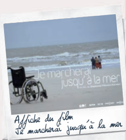
Affiche du film Je marcherai jusqu'à la mer