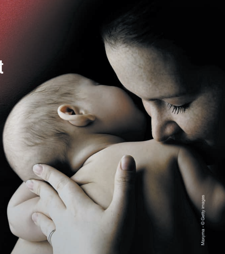
Maxyma - © Getty images

Depuis plus de neuf siècles, geste après geste, inspiré par les valeurs chrétiennes, l'Ordre de Malte accueille et secourt les plus faibles sans distinction d'origine ou de religion. Nous mobilisons plus de 1 500 collaborateurs et des milliers de bénévoles pour servir les personnes fragilisées par la maladie, le handicap, l'âge ou l'exclusion. Confiez à l'Ordre de Malte France ce que vous avez de plus précieux. Les biens transmis seront entièrement consacrés à notre mission charitable.