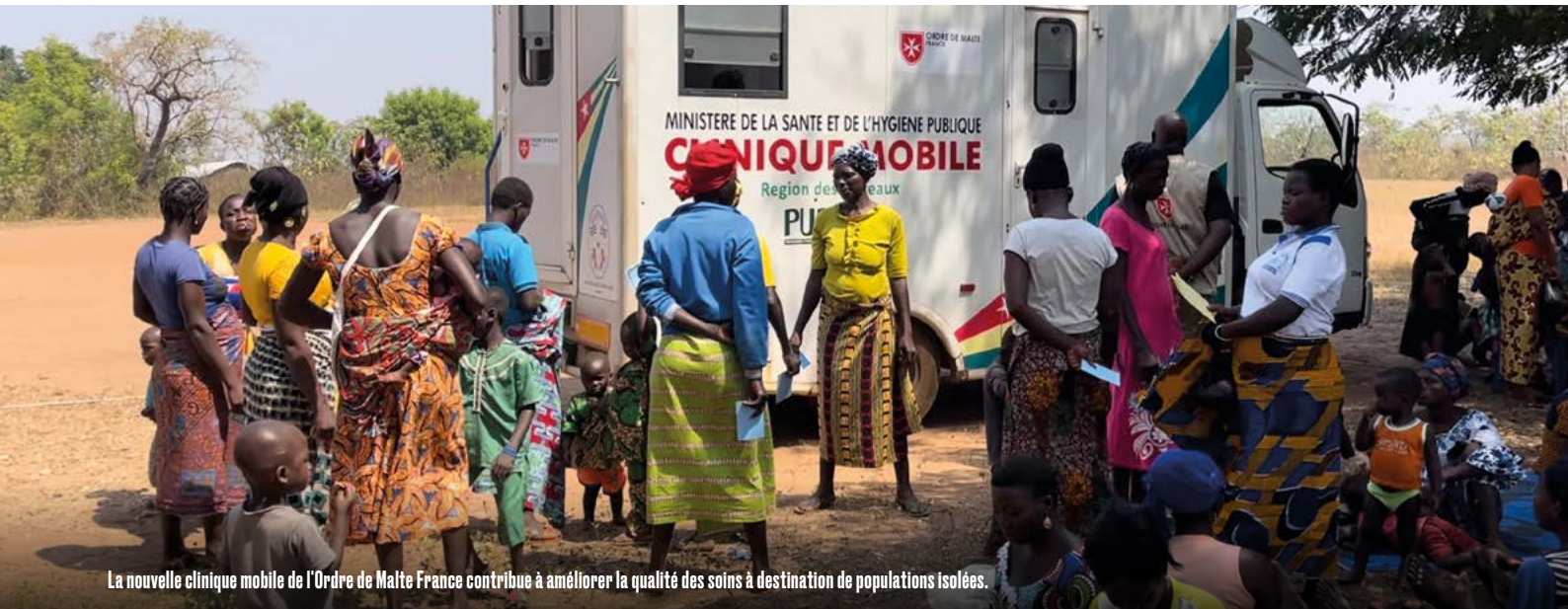
La nouvelle clinique mobile de l'Ordre de Malte France contribue à améliorer la qualité des soins à destination de populations isolées.

bler le manque de connaissances des populations concernant certains sujets médicaux. Beaucoup pratiquent des médecines traditionnelles et/ou l'automédication et beaucoup sont encore peu familiers du milieu hospitalier. Cette méconnaissance du secteur retarde leur venue à l'hôpital, souvent trop tardive car elle a lieu en ultime recours. » Des sessions de sensibilisation (à l'hôpital, à l'occasion des tournées de stratégie avancée et lors des émissions de radio hebdomadaires) vont donc venir compléter celles déjà mises en place sur la nutrition. La sensibilisation touche différents thèmes selon les spécialités médicales des intervenants ou selon la saisonnalité, avec pour objectif l'augmentation du recours aux soins par l'information, l'éducation et la communication.