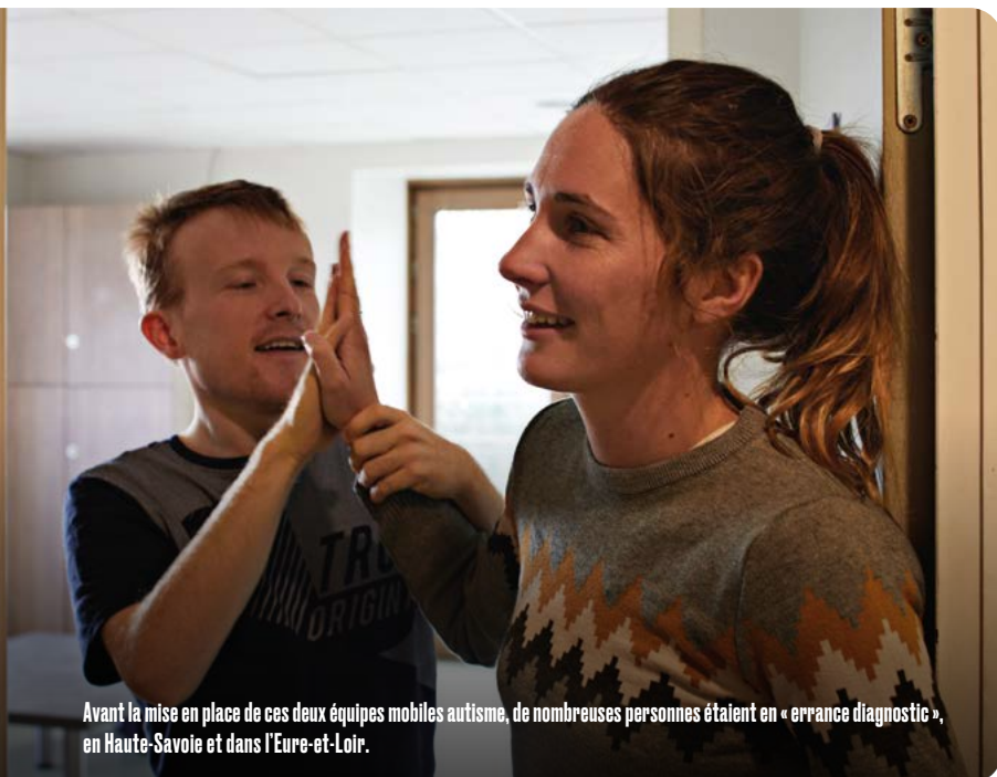
Avant la mise en place de ces deux équipes mobiles autisme, de nombreuses personnes étaient en « errance diagnostic », en Haute-Savoie et dans l'Eure-et-Loir.