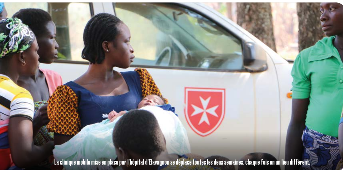
La clinique mobile mise en place par l'hôpital d'Elavagnon se déplace toutes les deux semaines, chaque fois en un lieu différent.

Autre défi à relever : le manque de relais d'information auprès des populations. Esteban Lamarque explique la politique de l'hôpital : « Nous voulons com-