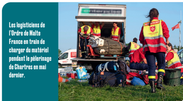
Les logisticiens de l'Ordre de Malte France en train de charger du matériel pendant le pèlerinage de Chartres en mai dernier.

Via un appel d'offres de services de secourisme. Nous y avons répondu, mais pas seuls, au sein d'un groupement interassociatif, avec la Croix-Rouge Française, la Fédération Française de Sauvetage et de Secourisme (FFSS), l'Union Nationale des Associations de Secouristes et de Sauveteurs (UNASS) et la Croix-Blanche. Ensemble, nous avons « gagné » 12 lots, chaque lot regroupant un sport et un lieu. La répartition est