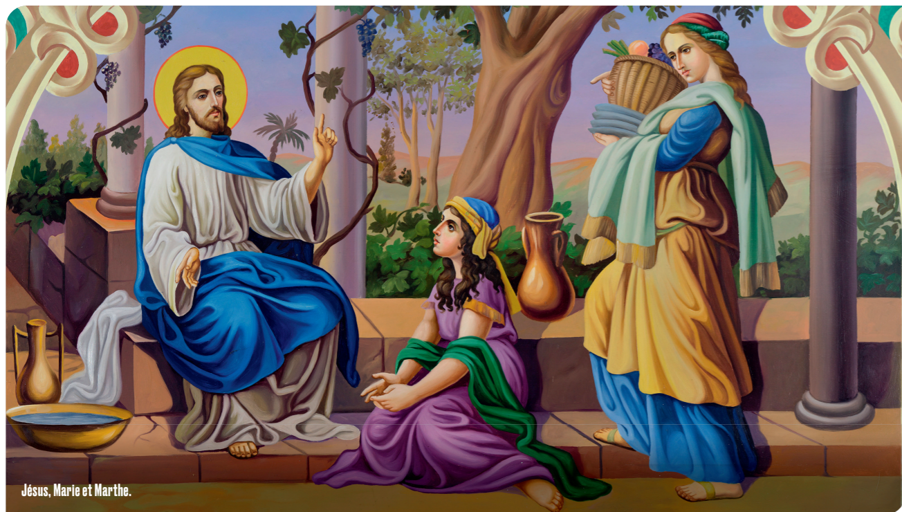
Jésus, Marie et Marthe.