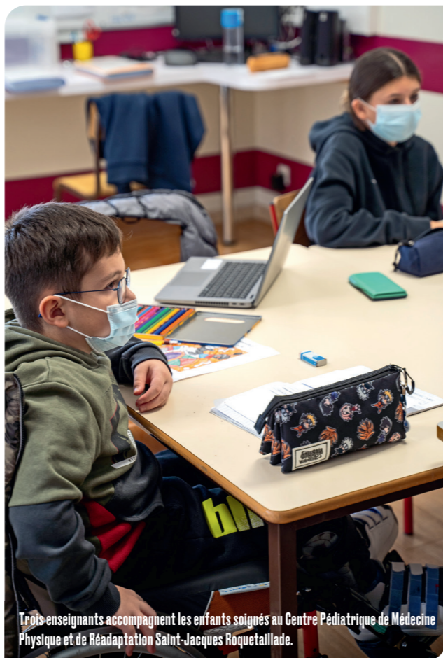
Trois enseignants accompagnent les enfants soignés au Centre Pédiatrique de Médecine Physique et de Réadaptation Saint-Jacques Roquetaillade.

accueille chaque année plus de 300 enfants. Au printemps, le centre a bénéficié du renouvellement de sa certification par la Haute Autorité de Santé (HAS). Il est reconnu pour la qualité du travail de ses soignants.