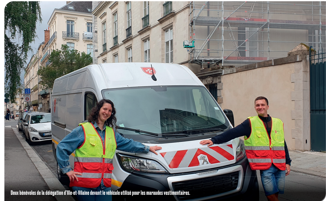
Deux bénévoles de la délégation d'Ille-et-Vilaine devant le véhicule utilisé pour les maraudes vestimentaires.