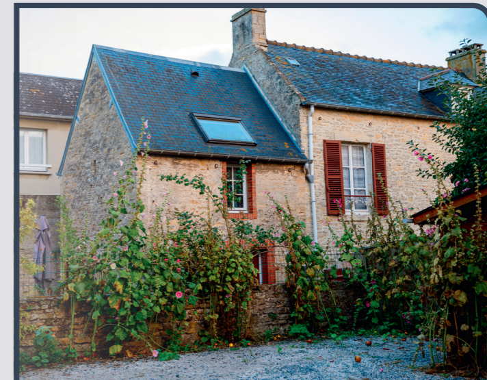
Pour des raisons de confidentialité, il s'agit d'une photo d'illustration.

➤ Le notaire vous apportera son expertise juridique et se chargera de faire enregistrer votre testament au Fichier Central des Dispositions de Dernières Volontés (FCDDV). ●