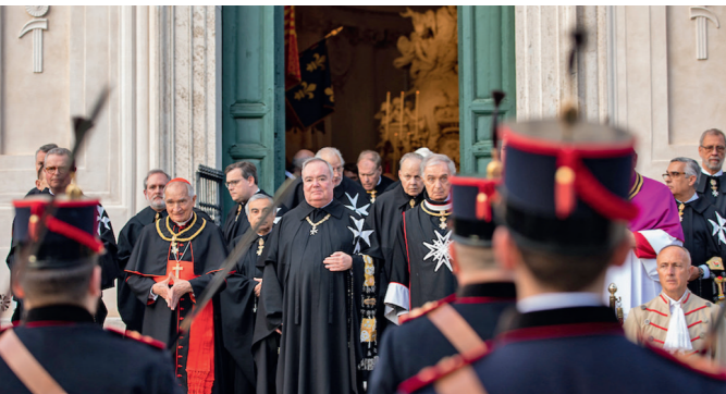
À Rome, Fra' John Dunlap a été élu, début mai, Prince et 81 e Grand Maître de l'Ordre Souverain militaire de Malte. Le Conseil complet d'État s'est réuni à Rome, dans la Villa Magistrale, et a élu Fra' John Dunlap à la majorité absolue des voix, sur la base d'une liste de trois noms indiquée par le Chapitre des Profès. Les électeurs étaient au nombre de 99 et provenaient de 18 pays différents.