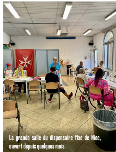
La grande salle du dispensaire fixe de Nice, ouvert depuis quelques mois.